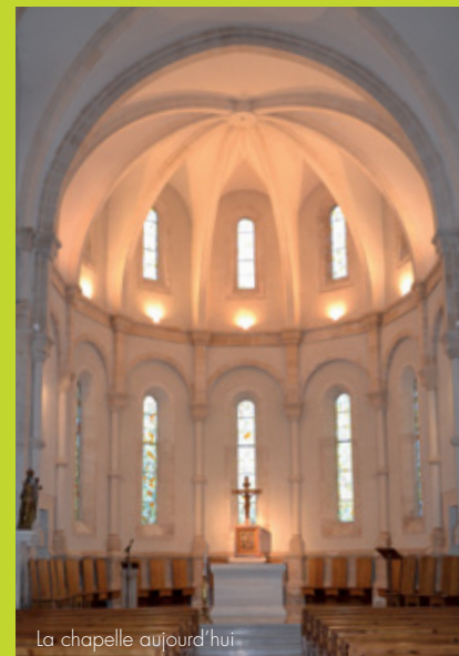
La chapelle aujourd'hui.

L'autel est au centre de l'église, « source d'unité pour l'Église » afin qu'elle