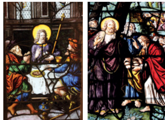
Vitraux de l'église Saint Étienne du Mont à Paris