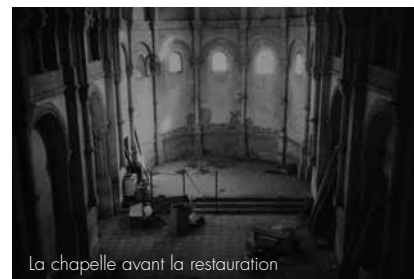
La chapelle avant la restauration