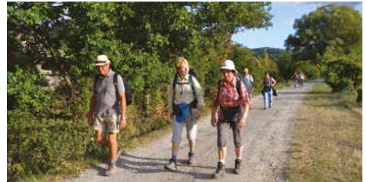
Randonnées dans les Monts de Vaucluse en septembre : nature, patrimoine, et vie spirituelle (activité organisée par Sainte-Garde)

Sainte-Garde propose restauration, hébergement et salles de travail dans un environnement exceptionnel, au cœur d'une nature aux mille senteurs et à proximité du village typiquement provençal de Saint-Didier.