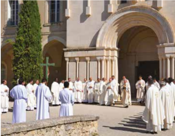
Retraite des prêtres du diocèse de Versailles.