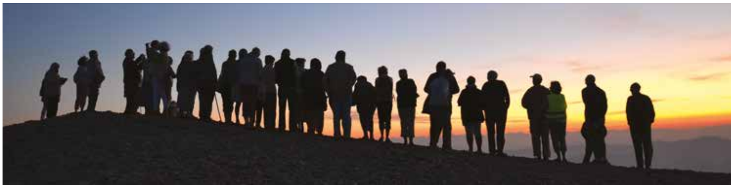
Le groupe "Mess'age" découvre le lever du soleil au sommet du Ventoux (août)